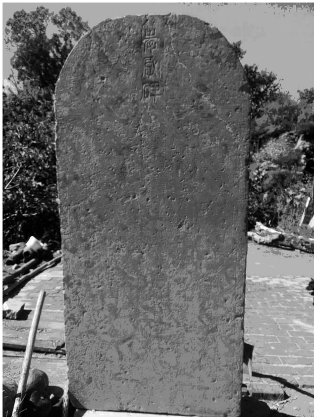
此刻石碑为明万历丙午三月。是记载平阳新修唐山又名尧山吴老坡道路的碑文

(三)在现存于金殿镇龙祠、神祠元惠宗至正九年(1349)的一通碑——《重修普应康泽王庙庆记》的碑文中写道:“易首以龙为乾卦之像。六爻拔挥,曲尽其义,是则龙之有神也宜矣,龙以韦为德也大矣”。接下来它以《易经》推理变数之术将水推位于